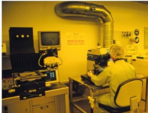
Philips Photonics: Vom Reinraum im Uni-Keller ins moderne Firmengebäude (v.l.)