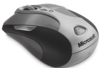
Laser-Maus mit Bewegungssensor