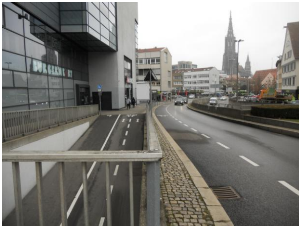
Neuer Schutzstreifen: Neue Str./ Friedrich-Ebert-Str

Bereits im letzten Radl-Newsletter haben wir über die Umleitung im Bereich Hauptbahnhof im Rahmen der Bauzeit berichtet. Radfahren auf der Straßenbahntrasse ist aus Sicherheitsgründen nicht gestattet. Daher empfehlen wir die großräumige Umfahrung über die Wengengasse. Alternativ darf die Fahrbahn der Friedrich-Ebert-Straße mitbenutzt werden. Für eine bessere Aufleitung auf die Fahrbahn wurde nun auf Höhe des Xinedomes ein Schutzstreifen markiert, der auch Kfz-Fahrende darauf aufmerksam macht, dass RadlerInnen die Fahrbahn mitbenutzen. Der Schutzstreifen wird dauerhaft markiert sein und im Endausbau des Bahnhofplatzes an einen Radweg auf der Ostseite der Friedrich-Ebert-Straße anschließen. Zudem wird in den kommenden Wochen die wegweisende Beschilderung in diesem Bereich angepasst.