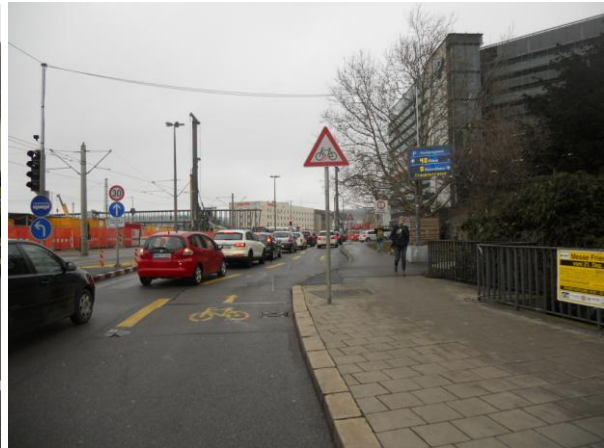
Markierung und Beschilderung an der Friedrich-Ebert-Str. zur Erhöhung der Aufmerksamkeit auf Radfahrende