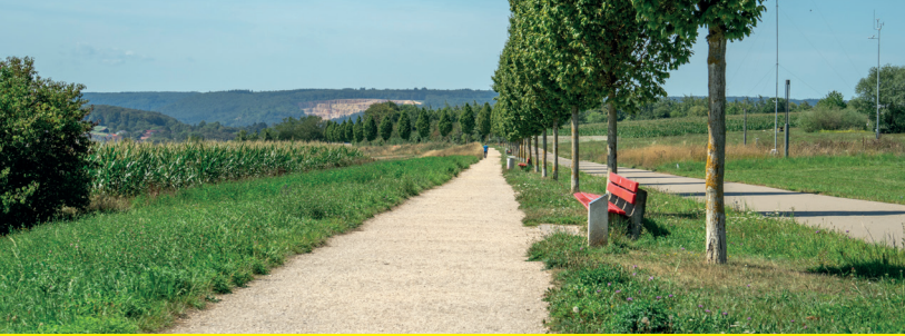
1 / Panoramaweg Eselsberg