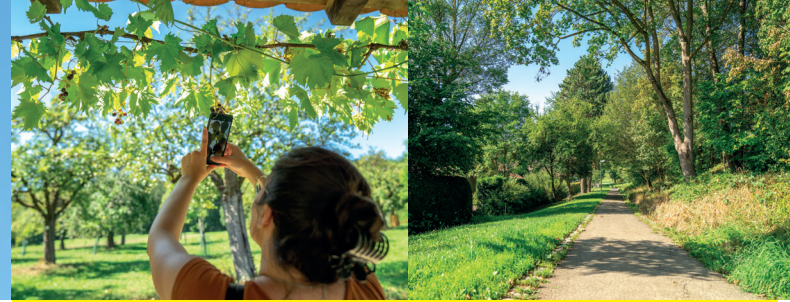
5 / Botanischer Garten