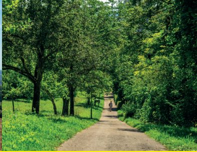
3 / Eselsberg