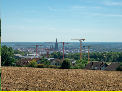
2 / Eselsberg