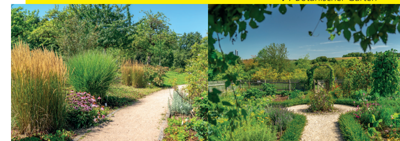
7 / Botanischer Garten

Herausgegeben von: Stadt Ulm, Öffentlichkeitsarbeit und Repräsentation sowie Stadtplanung, Umwelt, Baurecht (2024) Text: Marlene Müller Gestaltung: Anne-Kathrin Riethdorf Titelbild: Steffen Layer Fotos: Stadt Ulm Kartengrundlage: Abteilung Vermessung Gedruckt auf 100 % Recyclingpapier (zertifiziert mit dem Blauen Engel)