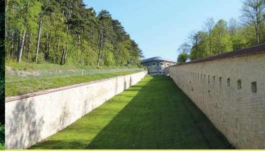
4 / Wilhelmsburg