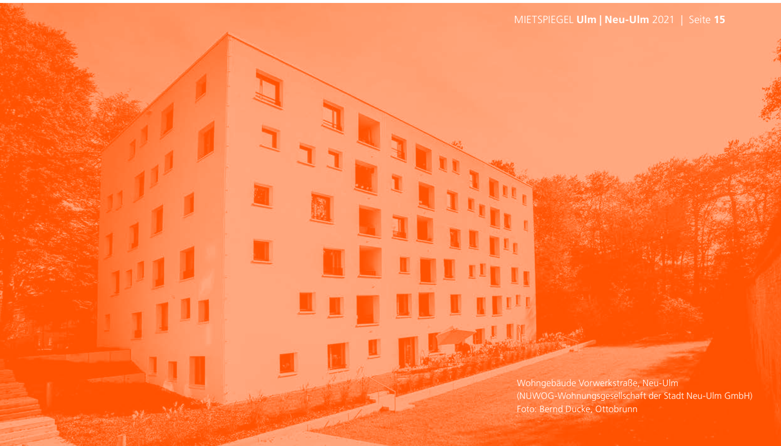
Wohngebäude Vorwerkstraße, Neu-Ulm (NUWOG-Wohnungsgesellschaft der Stadt Neu-Ulm GmbH)