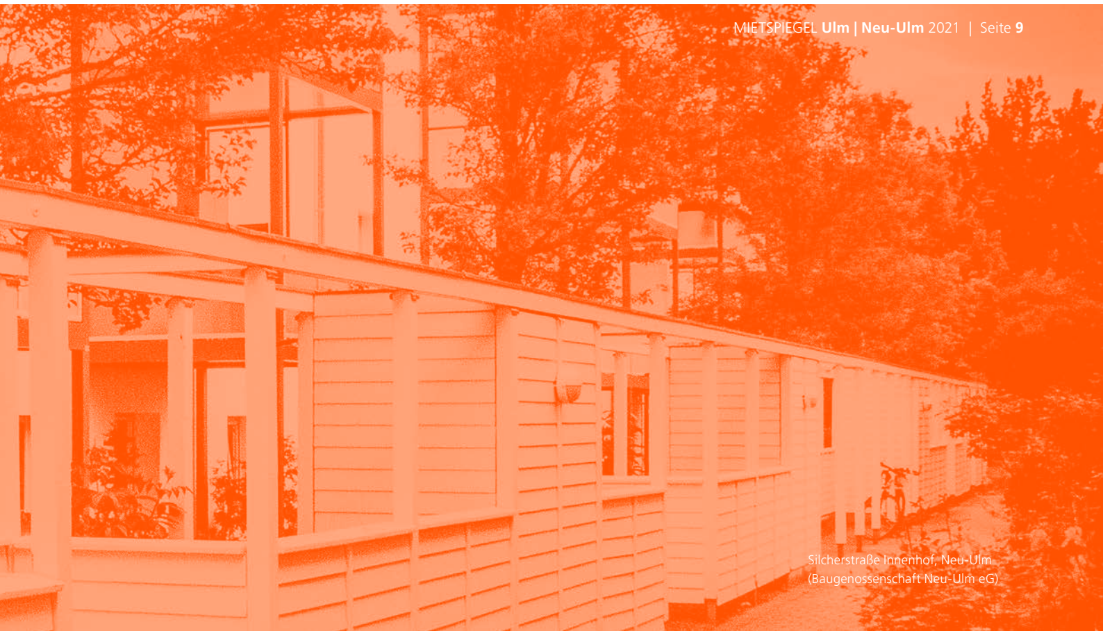
Sicherstraße Innenhof, Neu-Ulm (Baugenossenschaft Neu-Ulm eG)

Der Vermieter muss das Mieterhöhungsverlangen dem Mieter gegenüber schriftlich geltend machen und begründen. Als Begründungsmittel gesetzlich anerkannt sind Gutachten eines öffentlich bestellten und vereidigten Sachverständigen, die Benennung der Mietpreise von mindestens drei Vergleichswohnungen, von Mietdatenbanken und von qualifizierten Mietspiegeln.