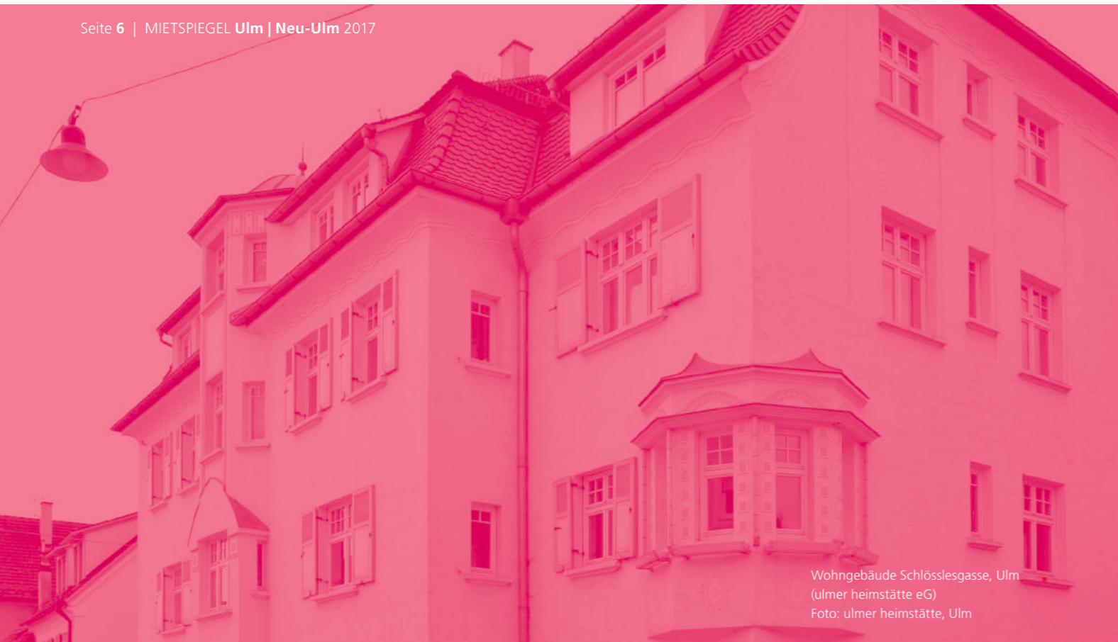
Wohngebäude Schlösslesgasse, Ulm (ulmer heimstätte eG)