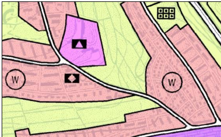
2: Rechtswirksamer Flächennutzungsplan

Im rechtswirksamen Flächennutzungs- und Landschaftsplan des Nachbarschaftsverbandes Ulm ist der Planungsbereich als Wohnbaufläche dargestellt. Die Festsetzung als allgemeines Wohngebiet stellt eine Konkretisierung der allgemeinen Art der baulichen Nutzung dar. Der vorliegende Bebauungsplan wird somit aus dem Flächennutzungsplan entwickelt.